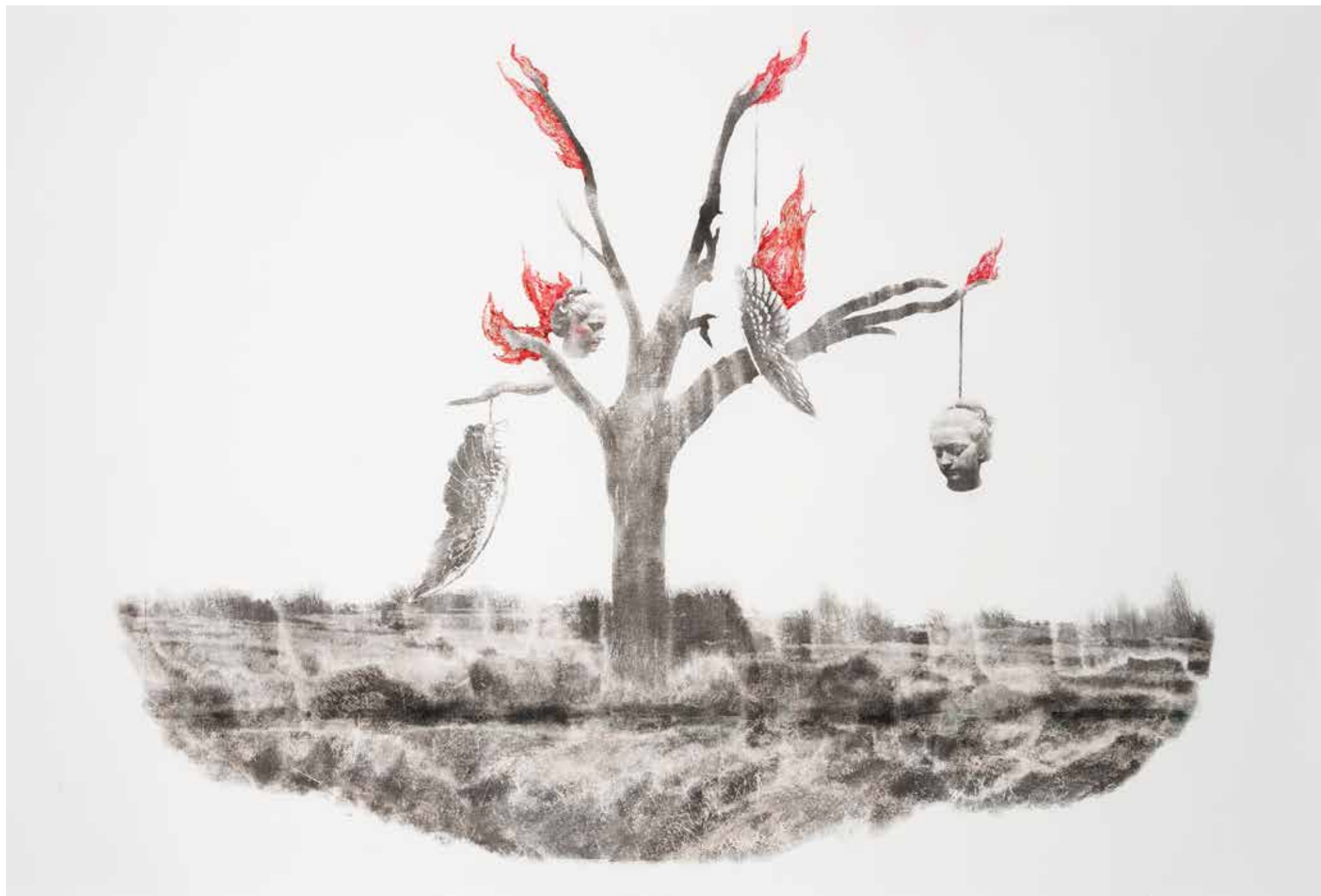
شماره ۱ از مجموعه‌ی بی‌نظمی منسجم، عکاسی صحنه‌پردازی شده، تکنیک انتقال تصویر و جوهر روی کاغذ، ۱۲۷×۲۰۳ سانتی‌متر، ۱۳۹۳ No. 1 from the Cohesive Disorder series, staged photography, image transfer technique and ink on paper, 127x203 cm, 2014