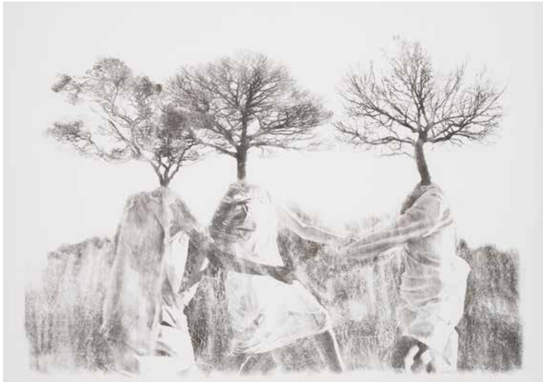
شماره ۴ از مجموعه‌ی بی‌نظمی منسجم، عکاسی صحنه‌پردازی شده، تکنیک انتقال تصویر و جوهر روی کاغذ، ۱۰۲×۱۵۲ سانتی‌متر، ۱۳۹۱ No. 4 from the Cohesive Disorder series, staged photography, image transfer technique and ink on paper, 102x152 cm, 2012