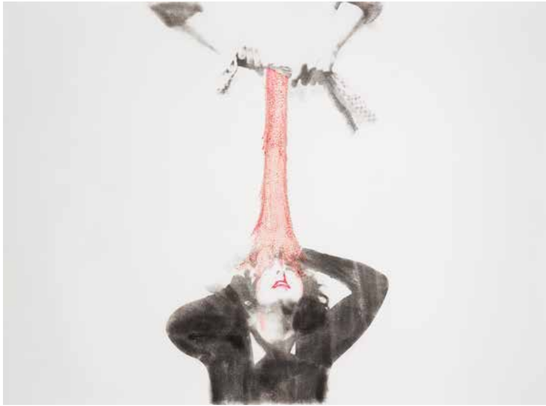
شماره ۲ از مجموعه‌ی بی‌نظمی منسجم، عکاسی صحنه‌پردازی شده، تکنیک انتقال تصویر و جوهر روی کاغذ، ۱۶۵×۱۲۷ سانتی‌متر، ۱۳۹۳ No. 2 from the Cohesive Disorder series, staged photography, image transfer technique and ink on paper, 127x165 cm, 2014