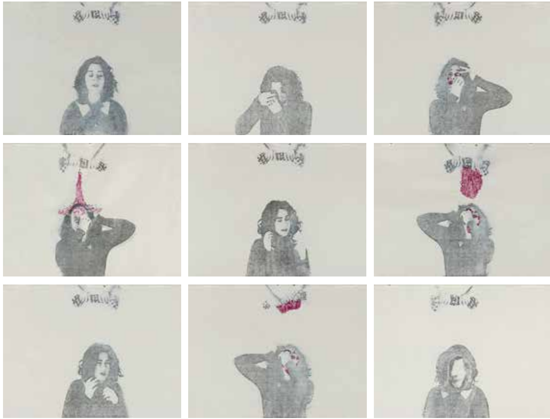
نمایی از ویدیوها شماره ۱ از مجموعه‌ی بی‌نظمی منسجم مدت زمان: ۲ دقیقه و ۳۵ ثانیه Video Still No. 1 from the Cohesive Disorder series Duration: 2:35"