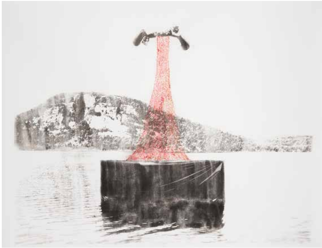
شماره ۳ از مجموعه‌ی بی‌نظمی منسجم، عکاسی صحنه‌پردازی شده، تکنیک انتقال تصویر و جوهر روی کاغذ، ۱۶۱×۱۲۷ سانتی‌متر، ۱۳۹۳ No. 3 from the Cohesive Disorder series, staged photography, image transfer technique and ink on paper, 127x161 cm, 2014