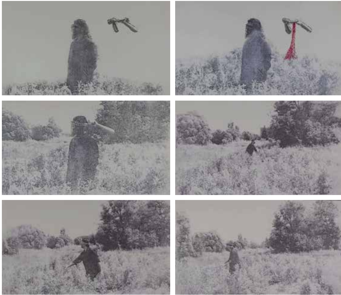
نمایی از ویدیوها شماره ۳ از مجموعه‌ی بی‌نظمی منسجم مدت زمان: ۷ دقیقه و ۵۶ ثانیه Video Still No. 3 from the Cohesive Disorder series Duration: 7:56"